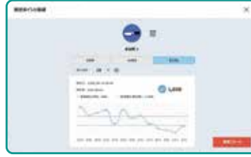
Her inceleme için zaman serisi verilerini görüntüleyin

Kaydedilen veriler uzman Uygulamamıza kayıt olarak zaman serilerinde görüntülenebilir. İnceleme geçiş oranları otomatik olarak grafiklerin ve iyileştirmeler görselleştirilebilir. Çalışanlar hijyen konusunda daha bilinçli olacak ve işinize daha fazla güven duymanıza yardımcı olacak yüksek bir çevre sağlığı standardını koruyacaktır.