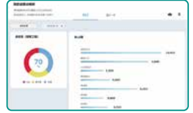
Genel denetim puanlarını grafikler aracılığıyla görselleştirin